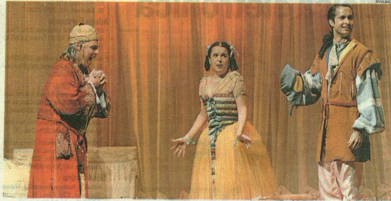
O ESPETÁCULO "O Doente Imaginário" conta a história de um senhor hipocondríaco que tenta casar a filha com um médico

"Molière mostra as pessoas como elas são. O que ele faz é retratar os desvios de comportamento do homem. O que o homem desen-