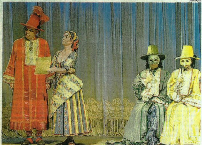
"O Doente Imaginário", escrita pelo dramaturgo francês Molière, será encenada pelo grupo carioca Limite 151